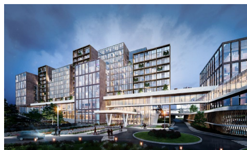
Universitair Ziekenhuis Saint-Luc, Brussel